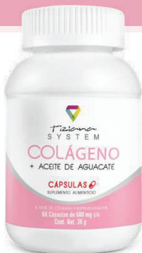
Bote con 60 cápsulas de 600 mg c/u

Así que si deseas consumir un suplemento que además de ayudarte a cuidar la belleza de adentro hacia afuera y mejorar tu salud no lo dudes mas y consume las capsulas de COLÁGENO + ACEITE DE AGUACATE .