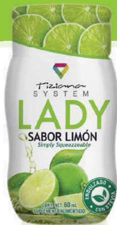
Bote con 60 mL sabor Limón

Lady Squeeze mezcla el Trébol Rojo, el cual posee un alto contenido de micronutrientes que ayudan a eliminar toxinas y depurar la sangre, así como mantener la densidad ósea adecuada para la mujer madura; adicionada con el Hongo Maitake, que ayuda al sistema inmunológico a tener una respuesta rápida frente a las enfermedades ó tratamientos invasivos; y el Hongo Shitake que contiene los 8 Aminoácidos Esenciales para nuestro organismo, rico en Vitaminas y Minerales, además, gracias a su fibra mejora la absorción de grasa, promoviendo la digestión y la salud del corazón.