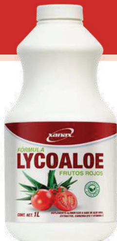
Bote con 1 litro

Lycoaloe Tónico de Xanax es una mezcla especial de pulpa de Aloe vera y Licopeno que logra una sinergia en beneficio de todo tu cuerpo.