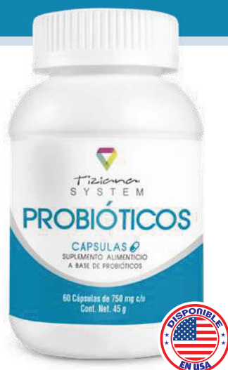
Envase 60 cápsulas de 750 mg c/u

El Lactobacilo acidófilo también produce la lactasa, enzima que descompone la lactosa, que es el azúcar que se encuentra en la leche, en azúcares más simples. Las personas con intolerancia a la lactosa no producen esta enzima, los suplementos con este probiótico son de gran beneficio para estas personas.