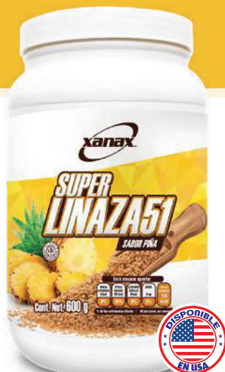
Bote con 600 g Sabor piña

El ritmo de vida actual, la ingestión excesiva de "comidas rápidas" aunado al sobre-procesamiento de los alimentos traen como consecuencia una serie de desórdenes digestivos y nutrimentales. La indigestión, el estreñimiento, la diabetes, alta presión y nerviosismo son solo algunos de los padecimientos que pueden ser ocasionados por deficiencias en la dieta. Xanax desarrolló la fórmula Super Linaza 51+ con sus ingredientes activos como Linaza molida, que es la fuente natural más rica en Aceites Omega 3, 6 y 9, que además de ejercer efectos sobre cierto número de actividades fisiológicas importantes (regulan la presión arterial), favorecen la producción de sustancias necesarias para la energía del metabolismo y del calcio. La Super Linaza 51+ es reforzada con Nopal y Cáscara Sagrada, dos hierbas ampliamente conocidas por su acción depurativa y laxante, estas hierbas combinadas con la Linaza dan como resultado un excelente producto para fortalecer el sistema inmunológico así como para el control de peso y evitar el estreñimiento.