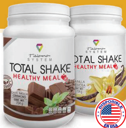
Bote con 704 g sabor Café Moca y Vainilla

Es un reemplazo completo, equilibrado y balanceado del desayuno o la cena, elaborado con ingredientes de primera calidad; Total shake ayuda a nuestro cuerpo a tener una mejor concentración y buena productividad a lo largo del día, así como a controlar el peso corporal mejorando nuestra salud y estado físico.