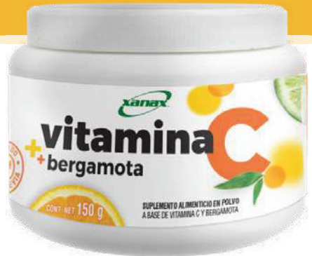
Envase con 150 g de polvo sabor naranja.

Ahora puedes ayudar a tu sistema inmunológico con Vitamina C + BERGAMOTA nuevo producto que presenta Xanax , polvo para preparar una deliciosa bebida efervescente, que contiene la mezcla de estos dos productos importantes para elevar el sistema inmune mediante una forma natural, fácil y agradable al paladar de cuidarse y mantener las defensas inmunitarias durante todo el año.