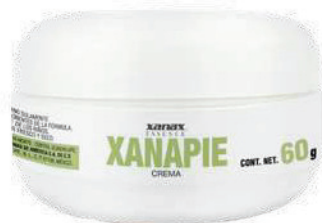
Bote con 60 g de crema.

Pensando en ello, Xanax Essence desarrolló Xanapie , una crema especialmente diseñada para suavizar, humectar y regenerar la piel áspera de los pies, refrescando el área de manera instantánea y proporcionando una sensación de descanso. Su combinación de ingredientes herbales mediante el proceso, permite desinfectar y refrescar los pies; además de ser un excelente auxiliar para eliminar los olores producidos por la sudoración excesiva y el encierro del calzado. El uso frecuente de Xanapie estimula la circulación, manteniendo sanos los pies. También se puede aplicar en muslos y pantorrillas proporcionando un efecto relajante elimina la comezón generada por la resequead, dejando una suave sensación aun en la piel más agrietada. Xanapie es un proceso patentado por Xanax E donde potencializamos los ingredientes activos de las plantas logrando una sinergia efectiva en la fórmula, dando como resultado una máxima absorción y equilibrio natural.